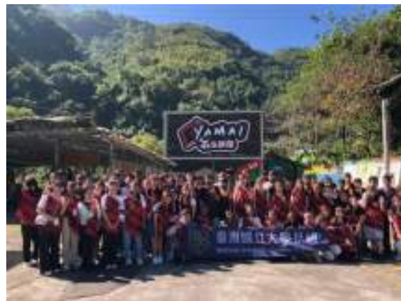
同學們在雅麥部落前大合照