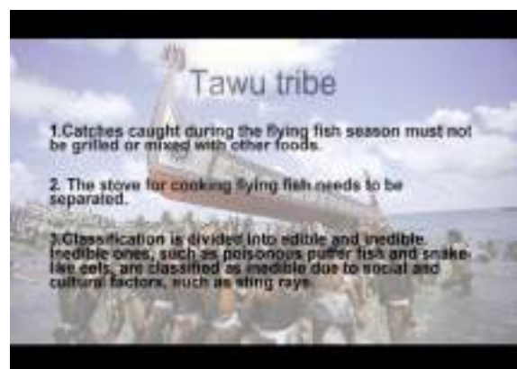
不只說嗨：跨國文化體驗學習微學分課程_與日本宮崎大學線上合辦