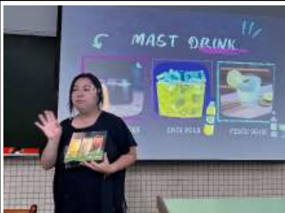
異鄉人就在你身邊-祕魯場