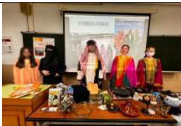
國際大師講座-中東國際禮儀與文化