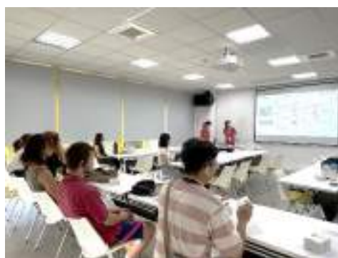
台中后里動物收容所：短講介紹