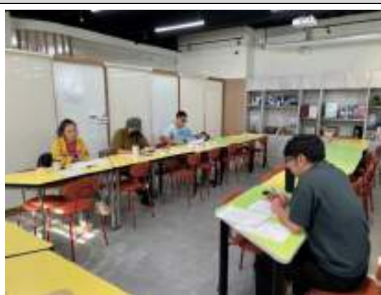
113.11.7 製糖科工廠初審會議