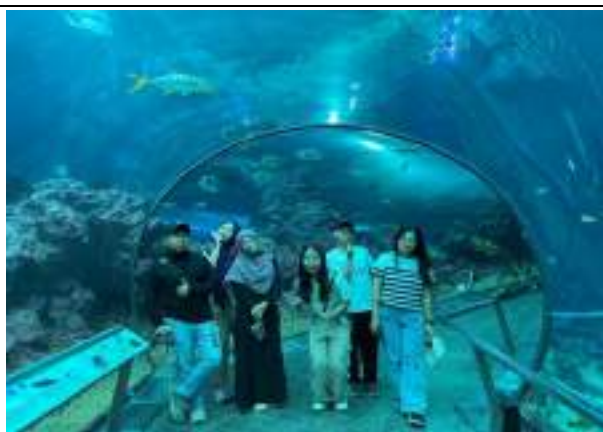
文化參訪- 境外生國立海洋生物博物館一日遊

(十八)偶跟國際生一日遊雲林：113年10月10日辦理偶跟國際生一日遊雲林交流活動，並結合2024國慶焰火在雲林於當天帶領參與學生前往高鐵會場。活動內容包含彩繪布袋戲偶活動、口湖馬蹄蛤主題