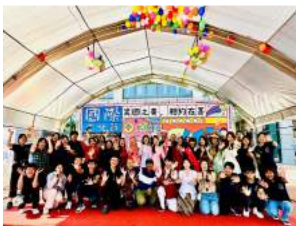
2024 國際文化節-異國之美 相約在嘉