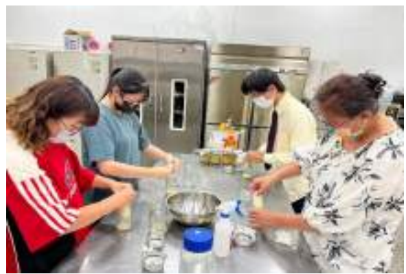
113.8.29 小麴與小米酒釀工作坊