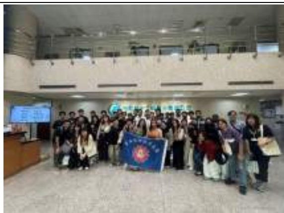
(二十七)彰化縣人文體驗工作坊：113年11月16日辦理，前往南彰化(彰化二林)，透過導覽和DIY體驗活動，進行一整天的米食文化體驗，共計68人參與。