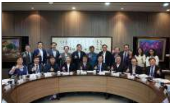
113.01.18 第 10 次系統委員會會議