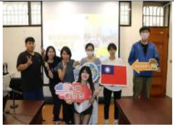
出國研修講座-逆風高飛-我在疫情期間 的留美生活(美國 YSU 雙聯學位)