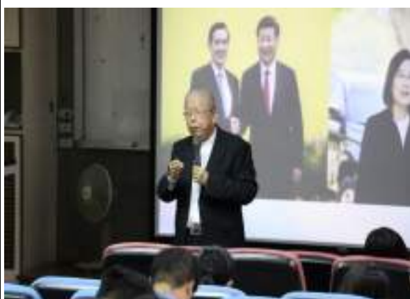
國際大師講座-外交工作經驗分享