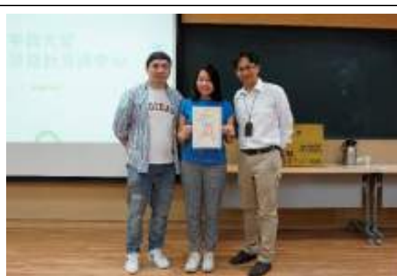
113.10.09 EMI 課程助教實用攻略 (主辦學校：國立聯合大學)