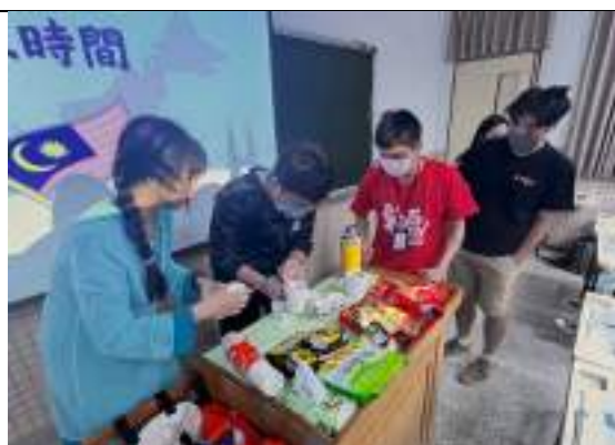
異鄉人就在你身邊-馬來西亞場