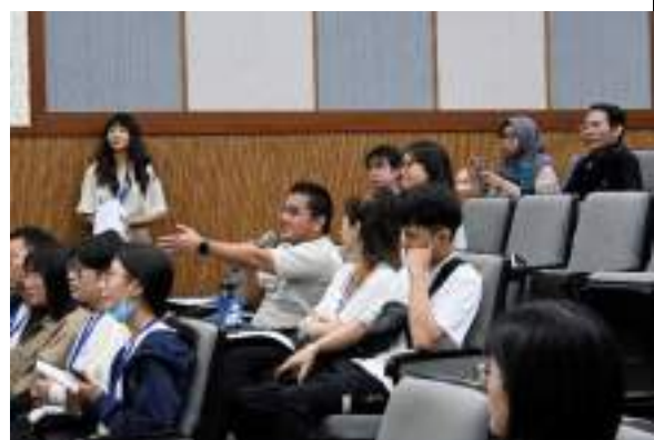
跨校國際研究生論壇