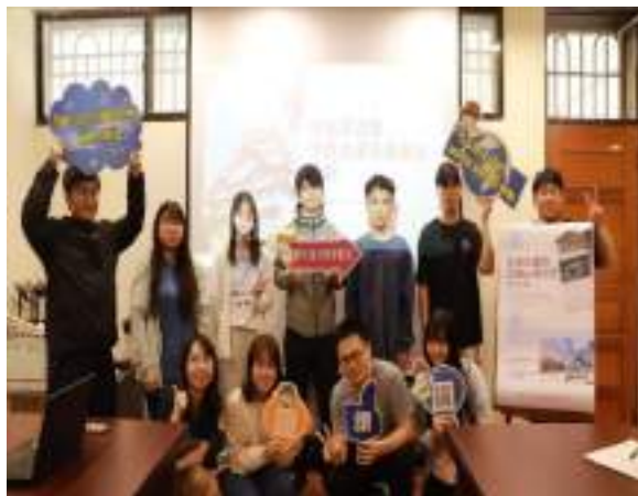
出國研修講座-在名古屋的交換心得分享 (中京大學)