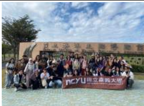
文化參訪- 境外生國立海洋生物博物館一日遊