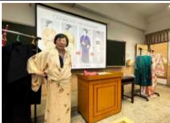
國際大師講座-日本國際禮儀與文化