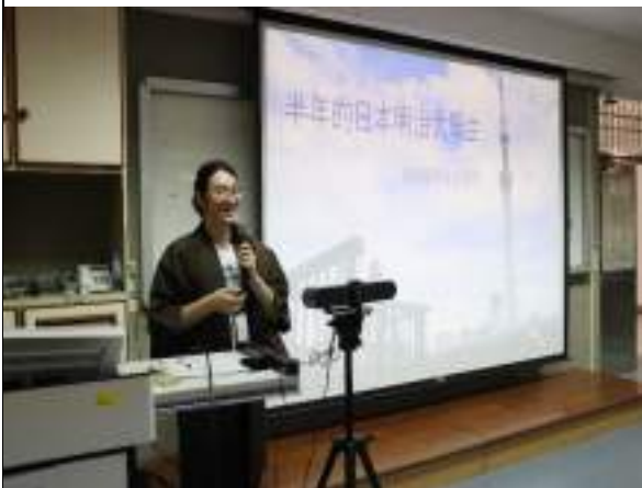
出國研修講座-半年的日本明治大學生