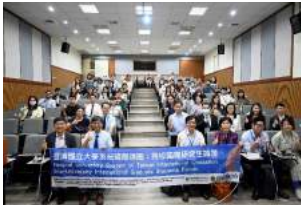
跨校國際研究生論壇