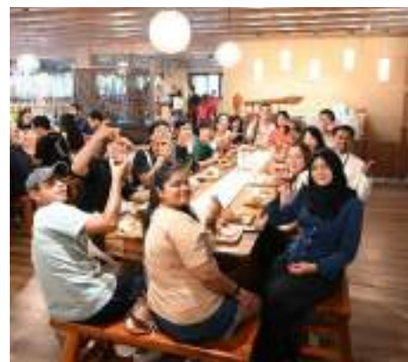
品嚐台灣紅茶及茶葉蛋