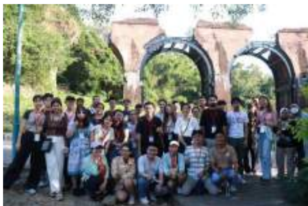
同學們在苗栗龍騰斷橋前合照