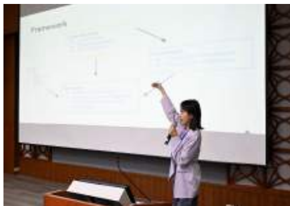
跨校國際研究生論壇