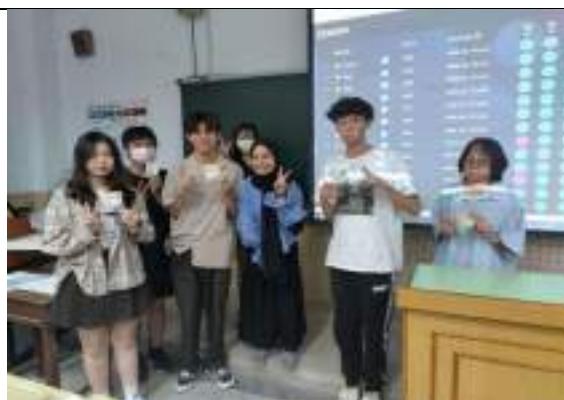
國際大師講座-印尼場