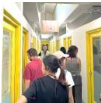
台中后里動物收容所：學生參訪貓舍