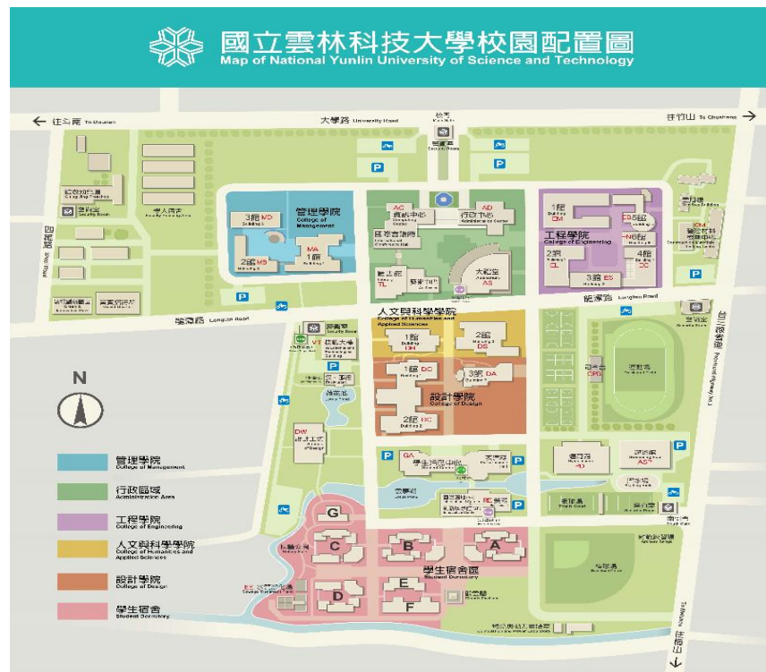
七、本校校園航照圖