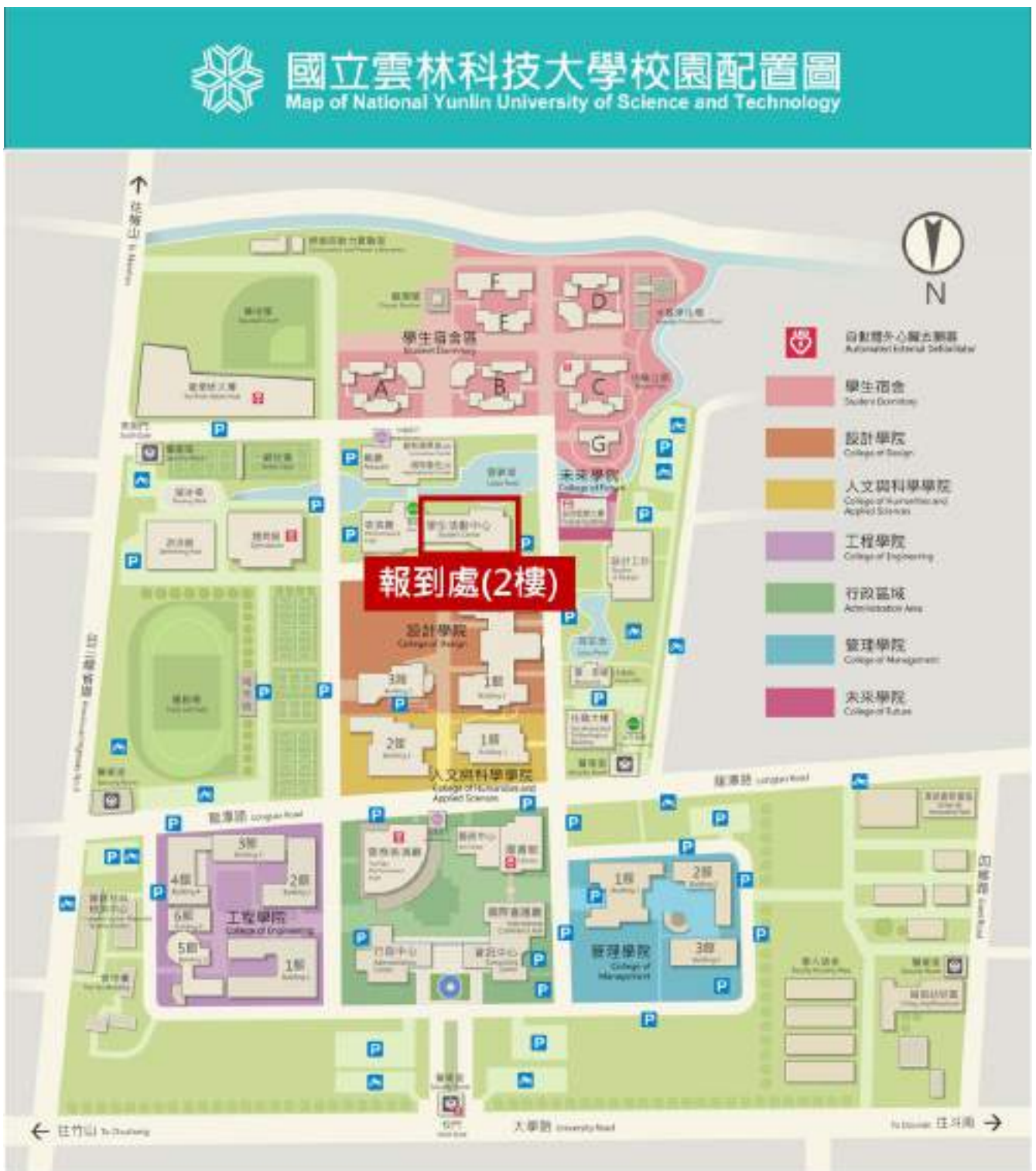
〔圖1〕報到地點路線圖

請參賽隊伍備妥 學生證 於12月7日(星期六)上午9時至9時30分一同完成報到，報到地點於本校活動中心2樓(圖1)。